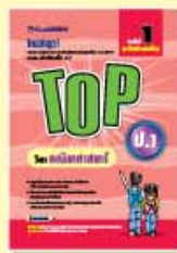
TOP ป.1-ป.3 ราคา 69 บาท

1. ชุด TOP เป็นหนังสือสรุปเนื้อหาสำคัญ ของหลักสูตร ป.1-ม.3 ในแต่ละวิชาของแต่ละระดับชั้นพร้อมแบบฝึกหัดท้ายบท เหมาะสำหรับนักเรียนใช้อ่านทบทวนความรู้อย่างมีประสิทธิภาพ เพื่อผลการสอบที่ยอดเยี่ยม จัดพิมพ์ด้วยกระดาษปอนด์สีขาวอย่างดี แยกเป็น 9 ชั้น ๆ ละ 5 วิชา คือ คณิตศาสตร์, วิทยาศาสตร์, ภาษาอังกฤษ, ภาษาไทย และสังคมศึกษา รวม 45 เล่ม ดังนี้