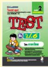
TEST ป.4-ป.6 ราคา 79 บาท