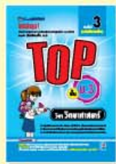
TOP ม.1-ม.3 ราคา 89 บาท

2. ชุด TEST เป็นหนังสือโจทย์แบบฝึกหัดเรียงตามบทเรียนแต่ละเรื่องของวิชานั้นๆ เหมาะสำหรับนักเรียนใช้ฝึกทำเพื่อทบทวนและพัฒนาความรู้ด้วยตัวเอง เพราะจะมีโจทย์ ที่ออกครอบคลุมทุกเรื่อง-ทุกประเด็น ครบถ้วนและพลิกแพลง ตั้งแต่ง่ายไปหายาก พร้อมเฉลยอย่างละเอียด จัดพิมพ์ด้วยกระดาษปอนด์สีขาวอย่างดี แยกเป็น 9 ชั้นชั้นละ 5 วิชาคือ คณิตศาสตร์, วิทยาศาสตร์, ภาษาอังกฤษ, ภาษาไทย และสังคมศึกษา รวม 45 เล่ม ดังนี้ (หนังสือชุดนี้จะเริ่มจำหน่าย 1 ธ.ค. 50)