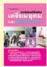
ราคา 199 บาท