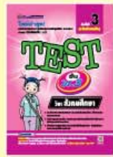
TEST ม.1-ม.3 ราคา 89 บาท