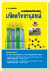
ราคา 129 บาท

เหมาะสำหรับนักเรียนชั้น ม.2-ม.3 เพื่ออ่านเตรียมสอบคัดเลือกเข้าเรียนต่อในแต่ละสถาบัน จัดพิมพ์ด้วยกระดาษปอนด์สีขาวอย่างดี แยกเป็น 3 เล่ม ดังนี้