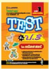
TEST ป.1-ป.3 ราคา 69 บาท

2. ชุด TEST เป็นหนังสือโจทย์แบบฝึกหัดเรียงตามบทเรียนแต่ละเรื่องของวิชานั้นๆ เหมาะสำหรับนักเรียนใช้ฝึกทำเพื่อทบทวนและพัฒนาความรู้ด้วยตัวเอง เพราะจะมีโจทย์ ที่ออกครอบคลุมทุกเรื่อง-ทุกประเด็น ครบถ้วนและพลิกแพลง ตั้งแต่ง่ายไปหายาก พร้อมเฉลยอย่างละเอียด จัดพิมพ์ด้วยกระดาษปอนด์สีขาวอย่างดี แยกเป็น 9 ชั้นชั้นละ 5 วิชาคือ คณิตศาสตร์, วิทยาศาสตร์, ภาษาอังกฤษ, ภาษาไทย และสังคมศึกษา รวม 45 เล่ม ดังนี้ (หนังสือชุดนี้จะเริ่มจำหน่าย 1 ธ.ค. 50)