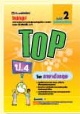
TOP ป.4-ป.6 ราคา 79 บาท