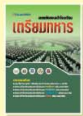
ราคา 299 บาท

มีวางจำหน่ายที่ร้านหนังสือชั้นนำทั่วประเทศ หรือสั่งซื้อโดยตรงที่