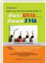
ก้าวหน้า ก้าวไกล ราคา 199 บาท