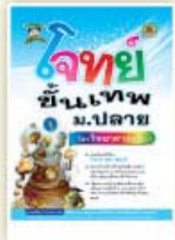
โจทย์ขั้นเทพ ม.ปลาย ราคา 199 บาท

ชุด โจทย์ขั้นเทพ และคลังโจทย์... หนังสือชุดเดียว ในประเทศไทย!! ที่มี "ตารางสรุปค่าสถิติของนักเรียนทั่วประเทศ" สำหรับใช้เปรียบเทียบเพื่อประเมินความสามารถของตัวเองในแต่ละวิชา ได้อย่างชัดเจน จัดพิมพ์หลายเล่ม แยกตามระดับชั้น โจทย์ครอบคลุม และพลิกแพลงหลายรูปแบบ เพื่อความเป็นเลิศเหนือระดับ พร้อมเฉลย ละเอียดเข้าใจง่าย เหมาะสมสำหรับใช้เตรียมสอบเพื่อวัดพื้นฐานความรู้, สอบคัดเลือกเข้าเรียนต่อ และสอบแข่งขันในทุกสนาม!