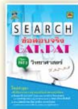
SEARCH ข้อสอบจริง GAT&PAT ราคา 199 บาท