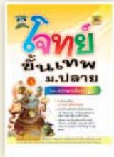
โจทย์ขั้นเทพ ม.ปลาย ราคา 199 บาท