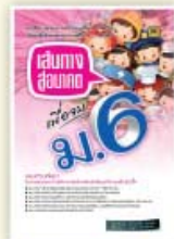
เส้นทางสู่อนาคตเมื่อจบ ม.6 ราคา 59 บาท