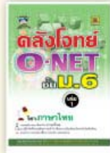
คลังโจทย์ O-NET ม.6 ราคา 199 บาท