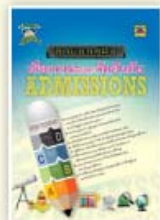
คู่มือเลือกคณะและจัดอันดับ ราคา 199 บาท