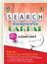
SEARCH ข้อสอบจริง GAT&PAT ราคา 129 บาท