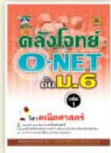
คลังโจทย์ O-NET ม.6 ราคา 199 บาท