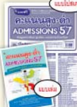
คะแนนสูง-ต่ำ ADMISSIONS ราคา 39 บาท

มีวางจำหน่ายที่ร้านหนังสือชั้นนำทั่วประเทศ หรือสั่งซื้อโดยตรงที่