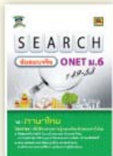
SEARCH ข้อสอบจริง ONET ม.6 ราคา 129 บาท