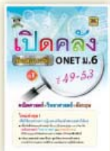
เปิดคลังข้อสอบจริง ONET ม.6 ราคา 299 บาท