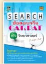
SEARCH ข้อสอบจริง GAT&PAT ราคา 199 บาท