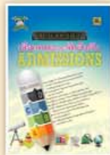
คู่มือเลือกคณะและจัดอันดับ ราคา 199 บาท