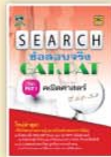
SEARCH ข้อสอบจริง GAT&PAT ราคา 129 บาท