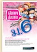
เส้นทางสู่อนาคตเมื่อจบ ม.6 ราคา 59 บาท