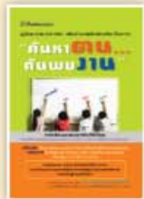
ค้นหาเส้นทางสู่อนาคต ราคา 199 บาท