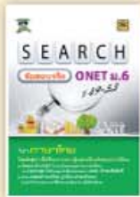
SEARCH ข้อสอบจริง ONET ม.6 ราคา 129 บาท