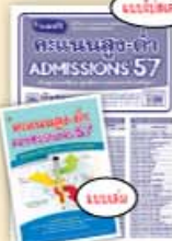
กระดาษแนบใบสมัคร ADMISSIONS 57 ราคา 39 บาท

มีวางจำหน่ายที่ร้านหนังสือชั้นนำทั่วประเทศ หรือสั่งซื้อโดยตรงที่