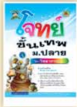
โจทย์ขั้นเทพ ม.ปลาย ราคา 199 บาท

ชุด โจทย์ขั้นเทพ และคลังโจทย์... หนังสือชุดเดียว ในประเทศไทย!! ที่มี "ตารางสรุปค่าสถิติของนักเรียนทั่วประเทศ" สำหรับใช้เปรียบเทียบเพื่อประเมินความสามารถของตัวเองในแต่ละวิชา ได้อย่างชัดเจน จัดพิมพ์หลายเล่ม แยกตามระดับชั้น โจทย์ครอบคลุม และพลิกแพลงหลายรูปแบบ เพื่อความเป็นเลิศเหนือระดับ พร้อมเฉลย ละเอียดเข้าใจง่าย เหมาะสำหรับใช้เตรียมสอบเพื่อวัดพื้นฐานความรู้ สอบคัดเลือกเข้าเรียนต่อ และสอบแข่งขันในทุกสนาม!