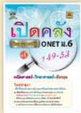
เปิดคลังข้อสอบจริง ONET ม.6 ราคา 299 บาท