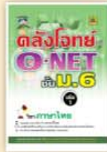
คลังโจทย์ O-NET ม.6 ราคา 199 บาท