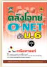
คลังโจทย์ O-NET ม.6 ราคา 199 บาท