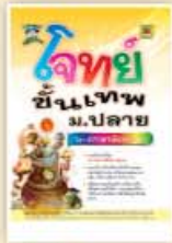
โจทย์ขั้นเทพ ม.ปลาย ราคา 199 บาท